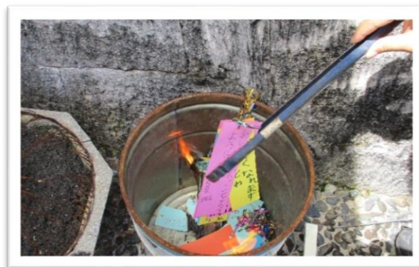
[七夕メッセージお焚き上げ]

※例年ですと、糸満市や遺族連合会にもご出席いただき、茶道裏千家淡交会の奉茶、糸満市文化協会の琉球古典音楽演奏、琉球フィルハーモニックメンバーの演奏なども行う盆供養です。