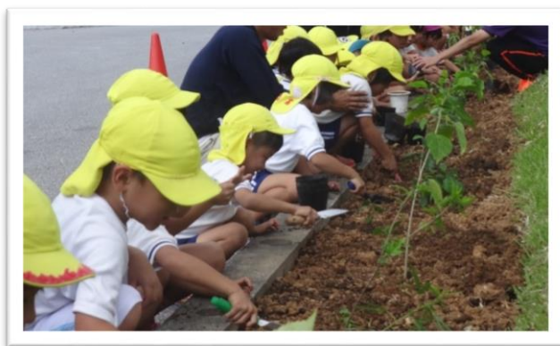
ハイビスカス苗の植え付けの様子（2019年）