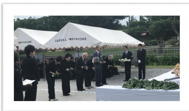
神奈川県による慰霊祭の様子（2019年）